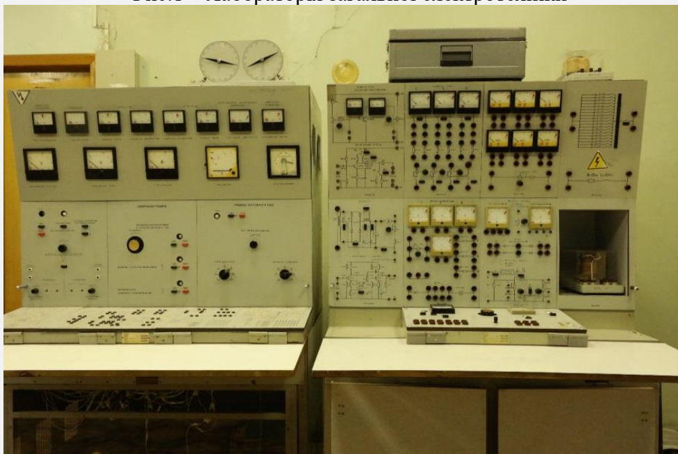
Рис.2 – Зовнішній вигляд лабораторних стендів ІВ-4 (8 шт.)