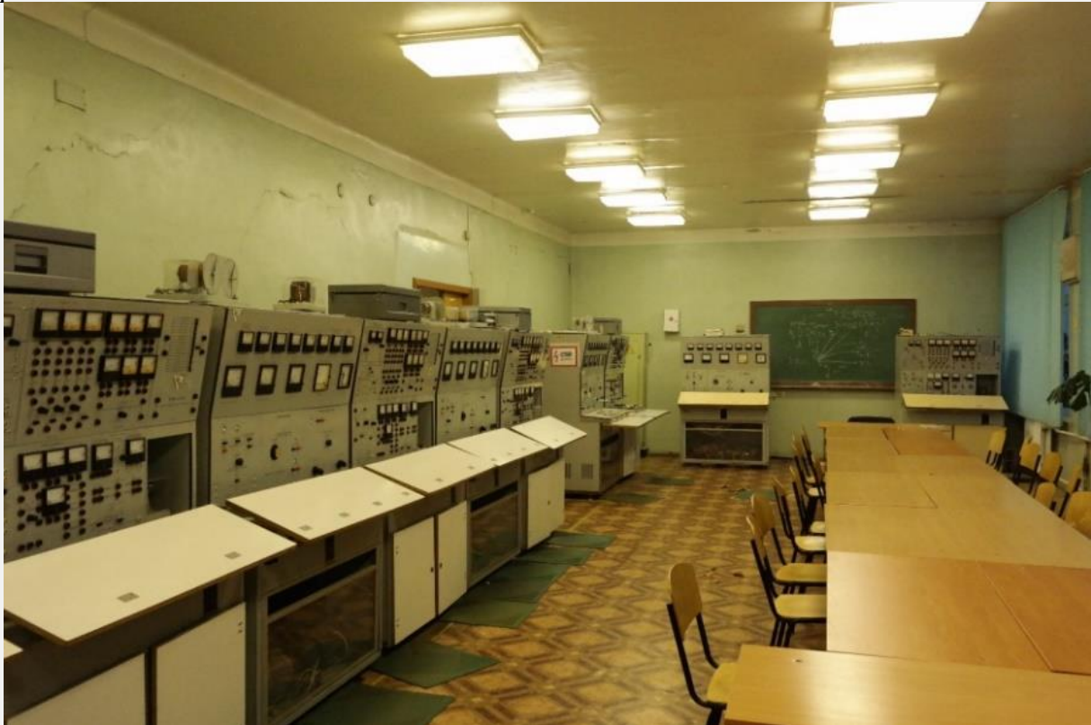
Рис.1 – Лабораторія загальної електротехніки

Лабораторні роботи дають можливість детально ознайомитися з електромагнітними процесами що відбуваються в пристроях, призначених для виробництва, передачі і розподілу електричної енергії, а також оволодіти практичними навичками їх налаштування і управління.